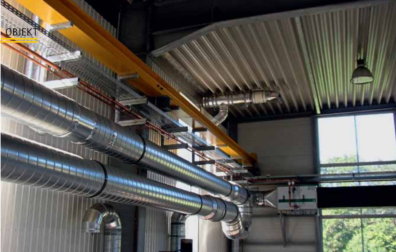
Das Kanalsystem des Luftkreises der Energiefassade mit Heiz- und Kühlregister im Hallenbereich.